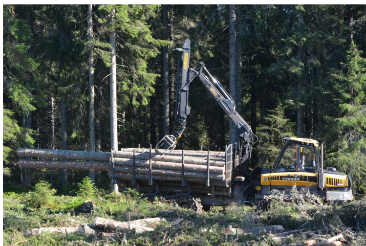
Utkjøring av sagtømmer og åstømmer fra drift i gammelskog ved Finnstuen

I all hovedsak er skurtømmer og massevirke solgt gjennom Mjøsen Skog SA til gjeldende priser, med tillegg for avtalte bonusordninger. Skurtømmer av gran har gått til RingAlm Tre AS. Granslipen har i stor grad gått med jernbane til Karlstadområdet i Sverige, samt et økende volum til Borregaard. Spesialsortimenter av furu er solgt laftetømmer til Løten Bygdesag. Noe massevirke, samt lauvtrevirke og energivirke er i tillegg solgt som ved.